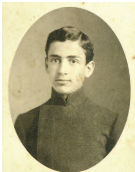
Студент реального училища. 1914г.