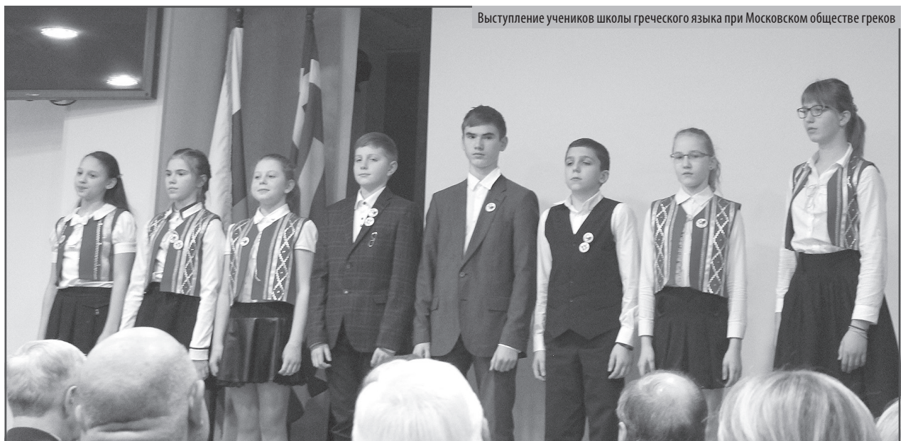
Выступление учеников школы греческого языка при Московском обществе греков