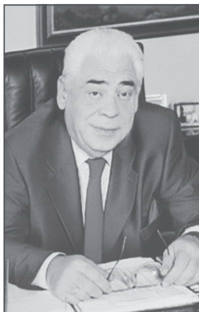
Мероприятие в МДН – это и реквием памяти нашего выдающегося соотечественника Д.Л. Орлова,