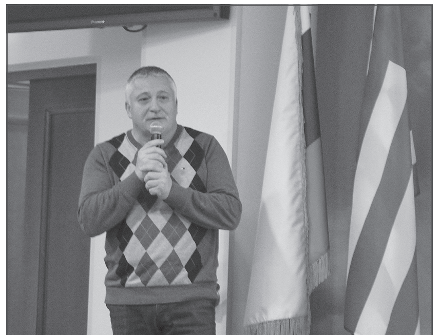
Выступление космонавта Федора Юрчихина: «Общение с Д.Л. Орловым было для меня большой жизненной школой»