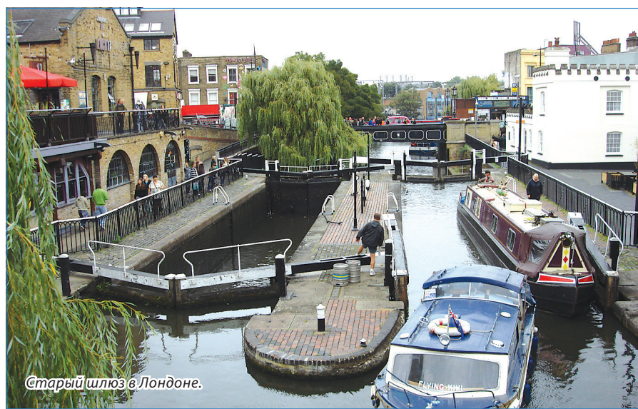
Старый шлюз в Лондоне.

Восхищался Тауэрским мостом, Биг-Беном, районами Пикадилли и