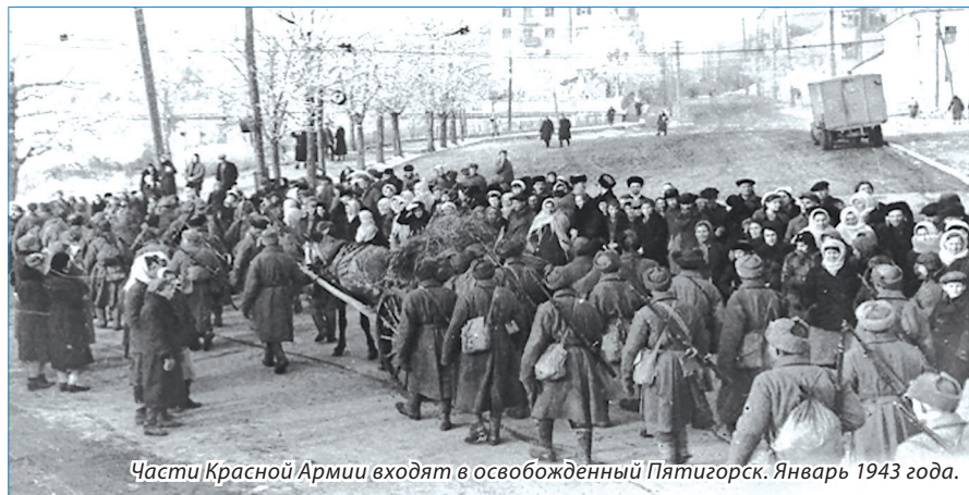
Части Красной Армии входят в освобожденный Пятигорск. Январь 1943 года.

Январским утром 1943 года советские танковые и моторизованные группы стрелковых частей вышли к восточным окраинам города Минеральные Воды. Танковый батальон под командованием капитана Петрова прорвался к железнодорожной станции и атаковал находившиеся на путях вражеские эшелоны. Вскоре к «воротам» Кавминвод подошли и главные силы 52-й танковой бригады.