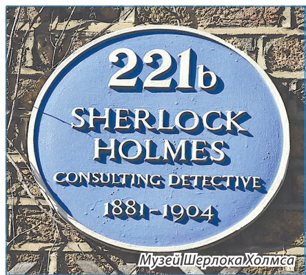
Музей Шерлока Холмса