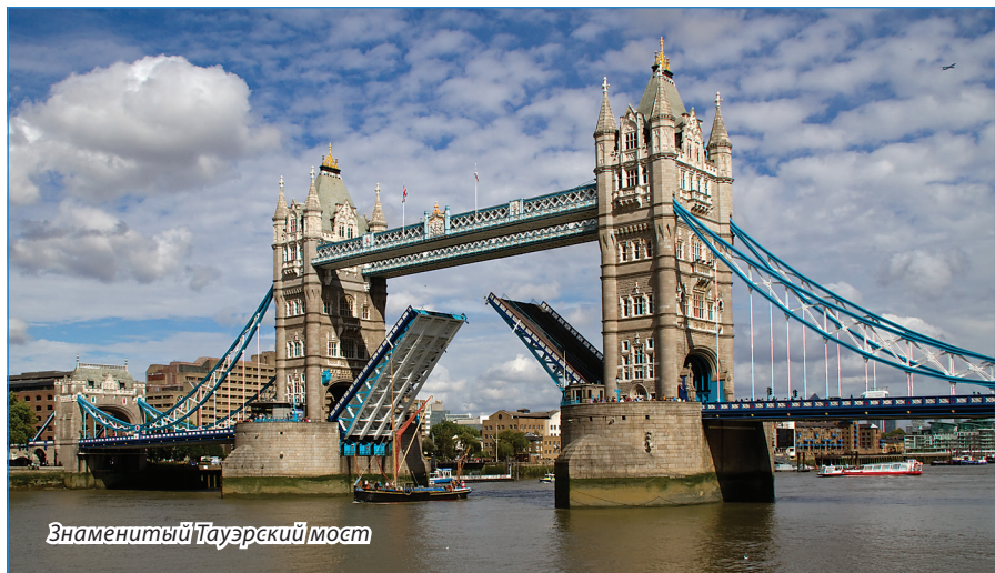
Знаменитый Тауэрский мост

Следующий мой приезд в Великобританию был символическим, ровно через 10 лет и в том же сентябре, но уже 2007 года, и уже с приобретенными коллегами, друзьями, поклонниками и родными, проживающими в Лондоне. И город уже такой мне до боли знакомый. Помому, прибавилось больше русской речи, и не было того, что в далеком 1997-м,