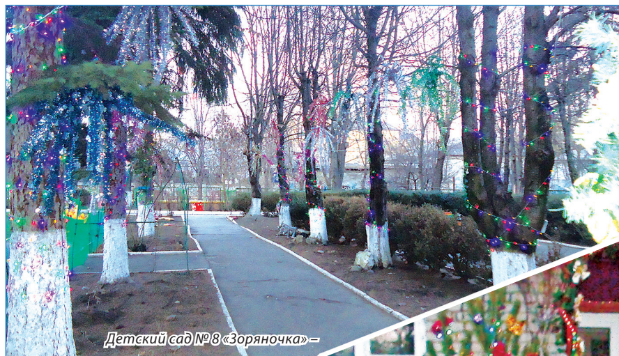
Детский сад №8 «Зоряночка»

територии был удостоен детский сад № 8 «Зоряночка». Победителем в номинации «Лучшее оформление внутреннего интерьера» назван детсад № 28 «Колосок». В последней номинации наградили еще двух победителей – кафе «Жемчужина» и санаторий «Казакстан».